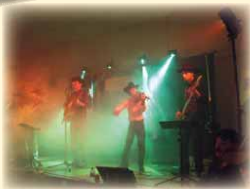
Bal country du 30 mai